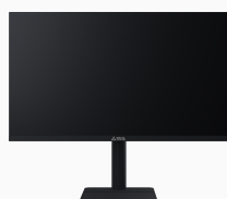
Монитор «Сова» OM238I