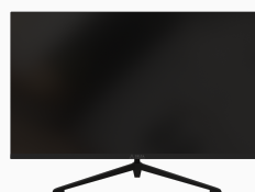
Монитор «Сова» OM315I